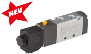
5/2 Wege (Federrückstellung)

Lieferumfang: RV-Ventil wird ohne Schrauben und Dichtungen geliefert. Bei Bedarf Schrauben und Dichtung (Typ V51-REP bzw. V52-REP) hinzubestellen. SR-Ventil wird einschließlich Schrauben und Dichtungen geliefert. Hinweis: Diese Ventile können einfach auf Ventilplätze eines bestehenden Ventilterminals aufgeschraubt werden um den Funktionsumfang eines Standardterminals zu erweitern oder ein defektes Ventil zu ersetzen.