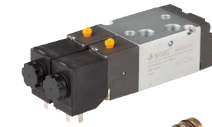
5/2 Wege (Impulsventil)