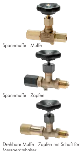
Spannmuffe - Muffe