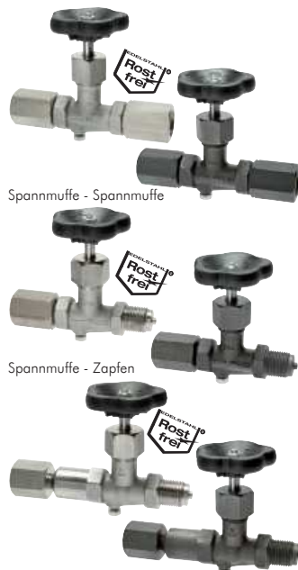
Spannmuffe - Spannmuffe