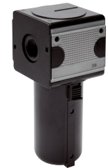
Typ FA 12 MBK