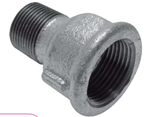
Typ 246/M4 red