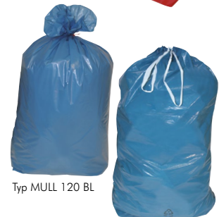
Typ MULL 120 BL