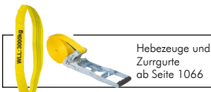
Hebezeuge und Zurrgurte ab Seite 1066