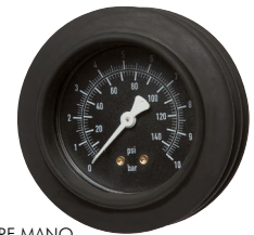
Typ HRF MANO