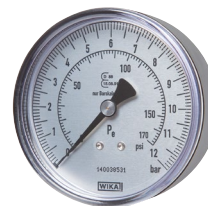
Typ HRFGS MANO