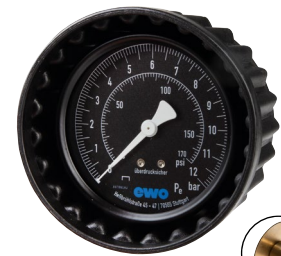
Typ HRFG MANO