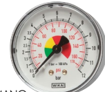
Typ HRFS MANO